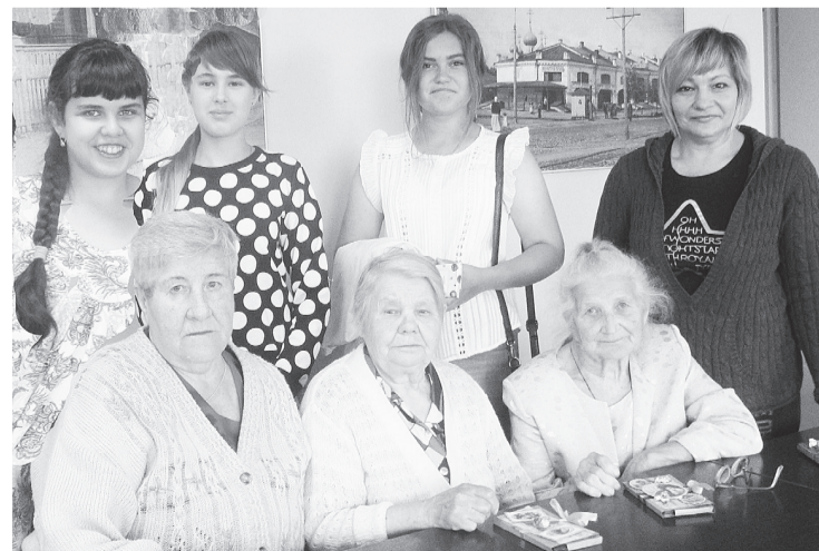
Восьмиклассники школы № 8 с увлечением проводят мастер-классы по рукоделию в Центре социального обслуживания