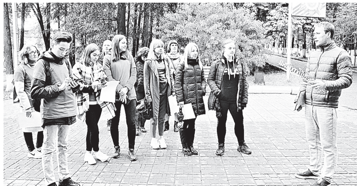
На каждой точке маршрута участники проекта делали фото и наносили отметку на Google-карты

Итогом реалити-игры стали красочные фото достопримечательностей и отредактированные, дополненные или нанесённые заново на карты Яндекс и Google культурно-исторические объекты. Светлана ИВАНОВА.