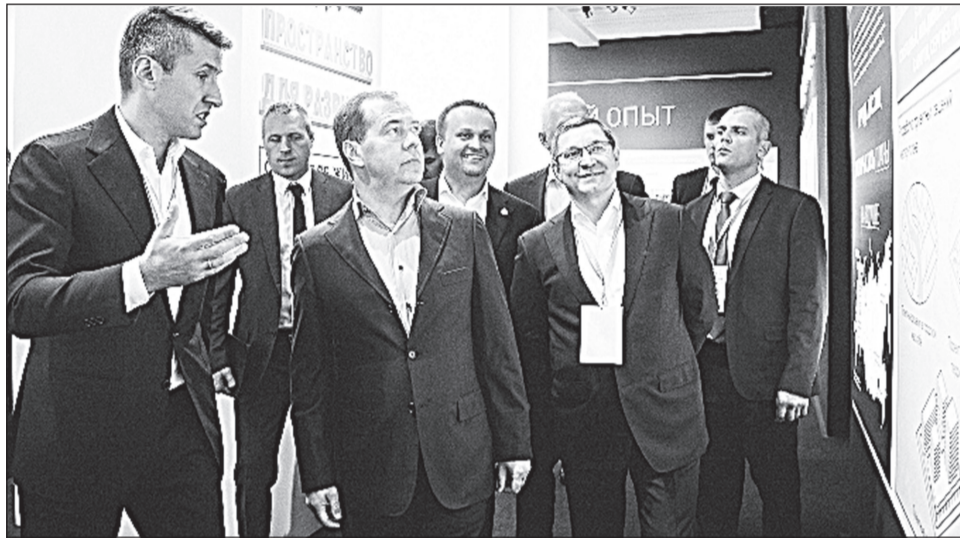
Дмитрий Медведев на выставке «Города — пространство для развития»

В Великом Новгороде прошёл всероссийский форум «Среда для жизни: города». Его посетили около 900 гостей из 69 субъектов Российской Федерации, в том числе председатель правительства РФ Дмитрий МЕДВЕДЕВ и министр строительства и ЖКХ РФ Владимир ЯКУШЕВ.