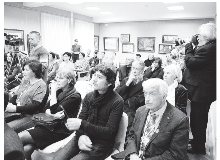
Участники конференции «Код Суворова» в Боровичском краеведческом музее

Организаторами конференции «Код Суворова» выступили Новгородский музей-заповедник, Государственный мемориальный музей Суворова и Президентская библиотека.