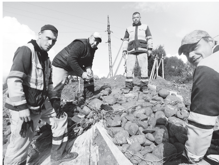
Рабочие укрепляют правый берег Мсты