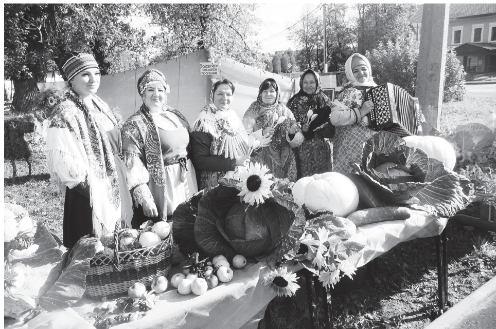
Волокское сельское поселение победило в номинации «Лучшая экспозиция»

В Доме народного творчества состоялся 8-й традиционный районный смотр-конкурс садоводов «Ветеранское подворье».