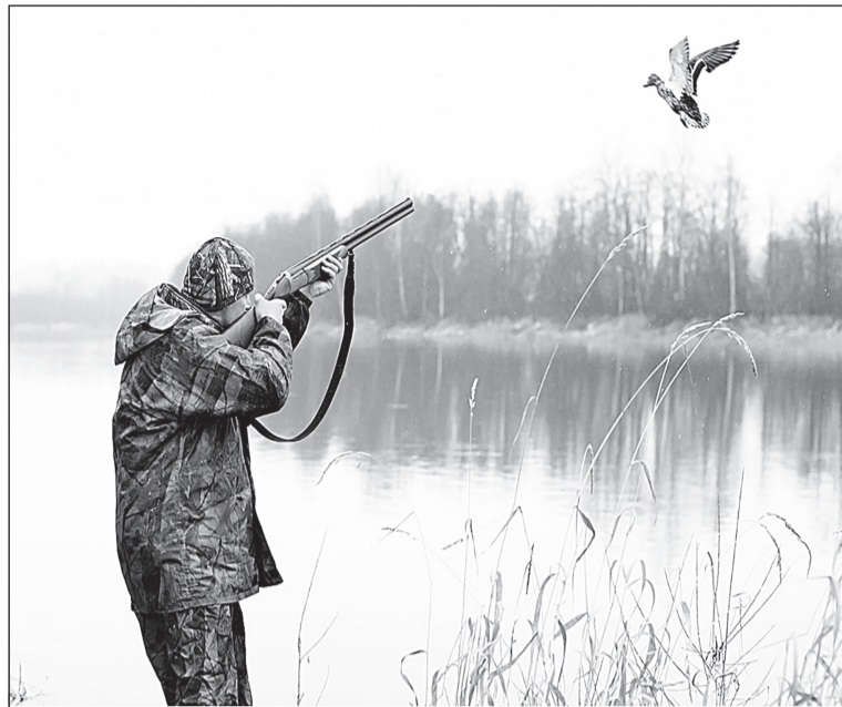
Охоту на водоплавающую дичь любят многие боровичские охотники.