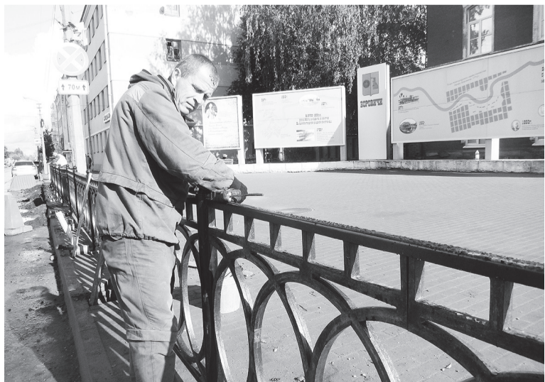
Декоративная решётка на перекрёстке в центре города

На улице Коммунарной устанавливают пешеходные ограждения, а на правом берегу Мсты укладывают каменные плиты. Выполняют работу боровичские организации «Солид» и субподрядчик «Альянс Групп».